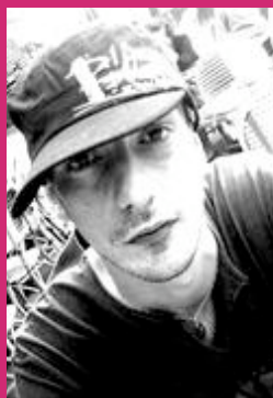
L'AUTEUR & METTEUR EN SCENE